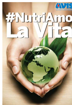
Locandina Avis per EXPO

Maggiori informazioni e programma delle uscite www.avismi.it