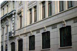
Il palazzo di via Solferino